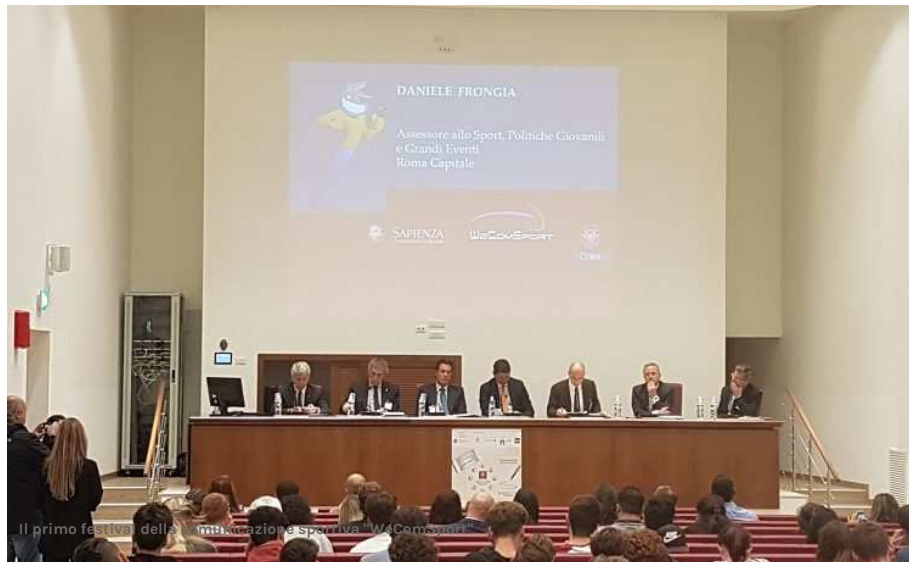
Il primo festival della Comunicazione Sportiva "WeComSport"

Mi piace Condividi Piace a 20 persone. Iscriviti per vedere cosa piace ai tuoi amici.