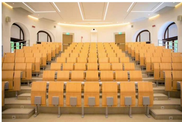
Sistema Prenotazione Aule